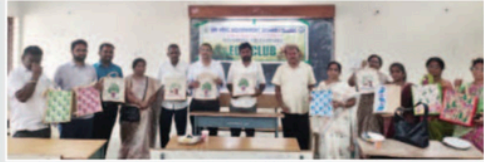
జ్యూట్ బ్యాగులు అందజేస్తున్న అధ్యాపకులు