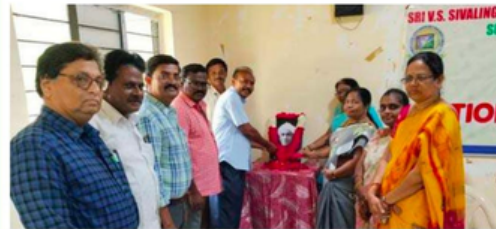
స్వర్ణసాగరం, సూక్ష్మారుపేట ఫిబ్రవరి 28 :