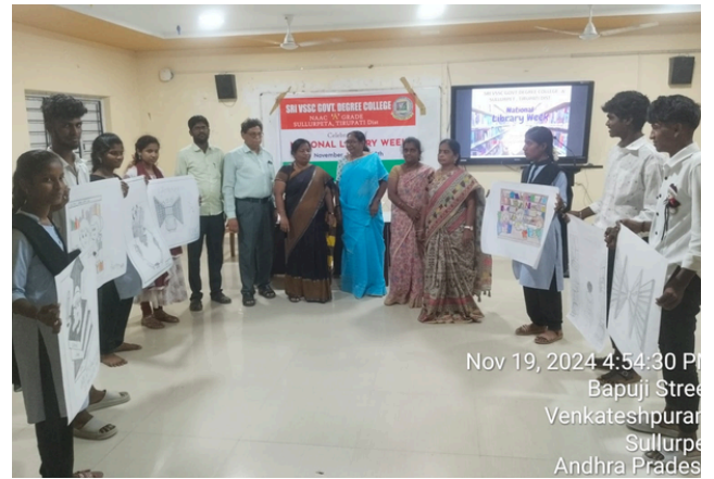
Nov 19, 2024 4:54:30 PM Bapuji Street Venkateshpuram Sullurpe Andhra Pradesh